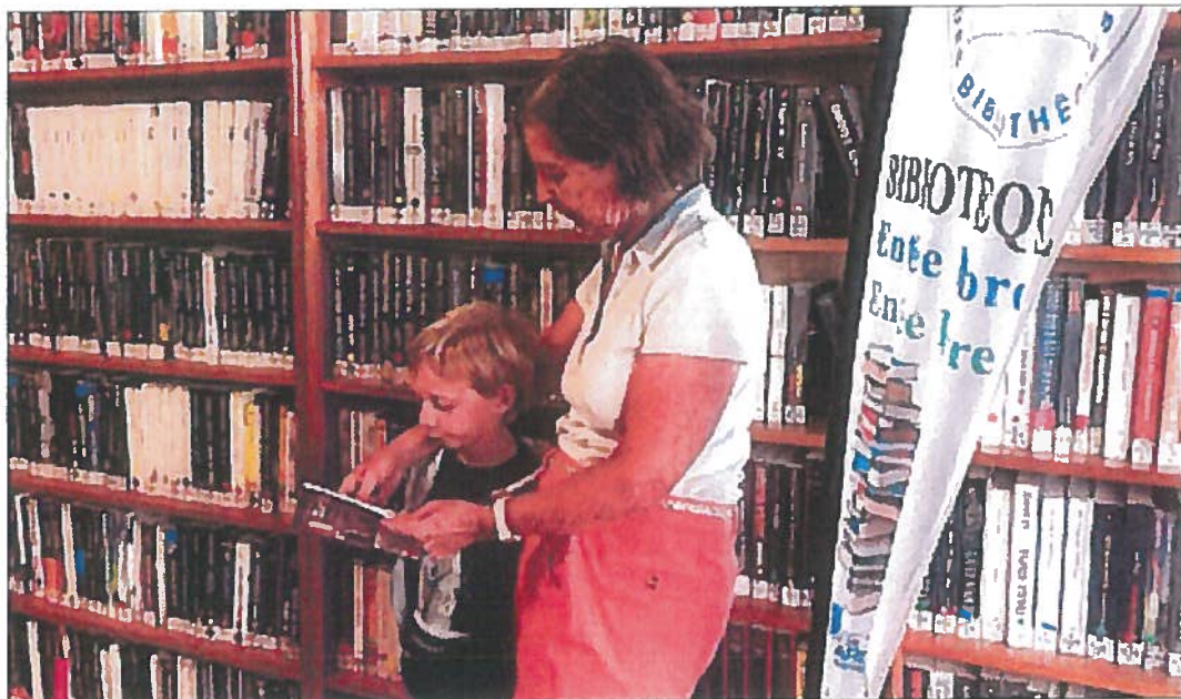
Créé en 1937, l'Office des bibliothèques est présent dans dix arrondissements de Marseille. Ses bibliothécaires savent prodiguer de précieux conseils de lecture.