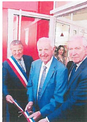
Traditionnel coupé de ruban.

Les centaines de personnes qui ont visité les lieux ont été unanimement conquises. La médiathèque ouvrira ses portes au public début septembre. Des permanences se tiendront cet été pour les anciens adhérents de la bibliothèque afin qu'ils puissent retourner des livres et en récupérer.