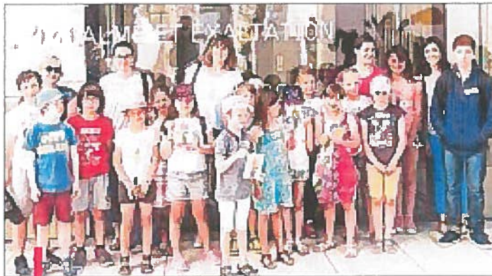
Les jeunes Saint-Martinois sont allés avec l'appui du CDC visiter une exposition à l'Espace Van Gogh d'Arles.

Puis une seconde action a été entreprise avec la visite par les élèves de l'atelier d'arts plastiques à l'espace Van Gogh pour de la rétrospective Alice Neel (1900-1984), l'une des plus importantes artistes nord-américaines, pourtant longtemps ignorée de son vi-