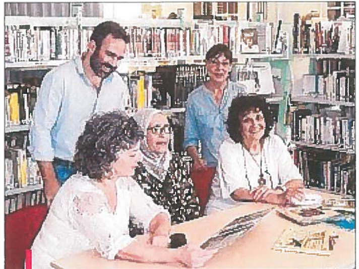
Bénévoles et bibliothécaires préparent une action destinée à se tenir un mercredi par mois.

Gratuit. Renseignements : 04 42 50 46 17.