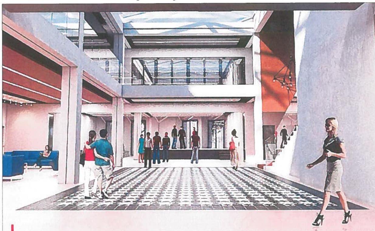
Une vue 3D du hall d'entrée, éclairé par une immense verrière, avec au fond une scène. À droite, l'accès à l'étage.